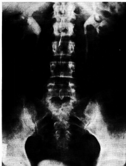
Fig. 3. Urografia excretória mostrando "caverna" em pólo superior do rim direito.

O quadro ocular apresentado pela nossa paciente preenche a maioria dos critérios diagnósticos da clássica "Maculopatia Idiopática de Leber": (1) unilateralidade, (2) exsudação macular em forma de estrela, (3) hiperemia e/ou edema do disco óptico, (4) edema seroso sub-retiniano peripapilar e (5) resolução do caso com recuperação total da visão (5,7,17) . Na maculopatia de Leber a resolução é espontânea e ocorre em 6 a 12 semanas, sem necessidade de tratamento. Está associada em 50% dos casos à